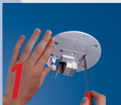
Monteer Easy-fit® bodemplaat

Ei is bedenker van het Easi-fit® systeem, een op Europa gericht snelmontagesysteem. Het uitgangspunt van Ei is een degelijke, universele en snelle/eenvoudige montage en alles conform de Europese en Nederlandse regelgeving. De melder zelf kan, nadat in het voorproces de bodemplaat is gemonteerd, aan het einde van het bouwproces snel op de bodemplaat geschoven worden (geen last van stof of diefstal tijdens bouwproces). Om vals alarm of een verminderde werking door stof te voorkomen, adviseren wij u de blauwe stofkap te gebruiken. Ei levert deze standaard mee bij elke optische melder. De Easi-Fit® sokkel is universeel: voor zowel Ei optische, als voor hittemelders. Bovendien is een extra sokkel voor montage op de wand of aan het plafond overbodig (K25 uitbreekpoort in sokkel).