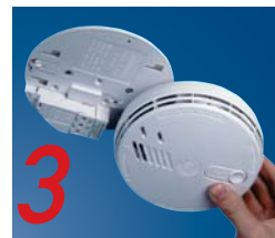
Schuif de melder op de bodemplaat