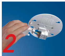
Sluit bedrading aan